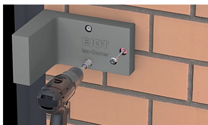
1 – Poser les chevilles adaptées