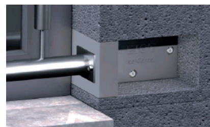
3 – Fixer l'élément avec les vis Ø 10 mm (trou Ø 8 mm) ISOCORNVIS KIT 2 VIS INOX DELTA PT 10X60/37-ISOCORN