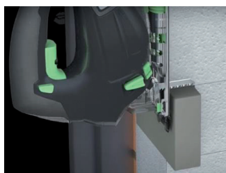
2 – Couper suivant l'épaisseur d'isolant