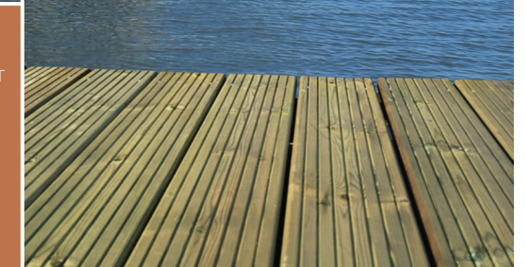
1. Grip Nordic / 2. Skin / 3. Grip Baltic

La préservation hydrofuge renforce l'effet déperlant et améliore la stabilité dimensionnelle.