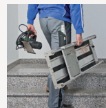
Table de coupe légères et facilement transportables

Réglage sans outil de l'inclinaison (jusqu'à 45°) et de la profondeur de coupe (jusqu'à 36 mm)