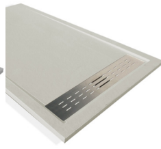
Ciment-C RAL 7035