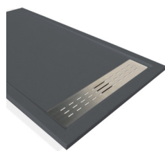
Anthracite-A RAL 7016