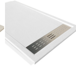
Blanc-B RAL 9003