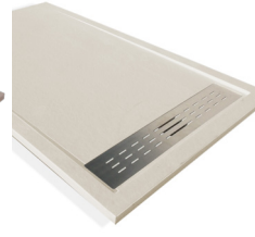
Crème-CR RAL 9001