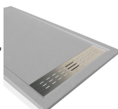
Gris basalte-GB RAL 7037