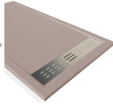
Moka-M RAL 1001