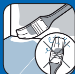
Ne peluche pas