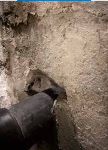
???????? de Mapeproof Swell avec Mapegrout T 40