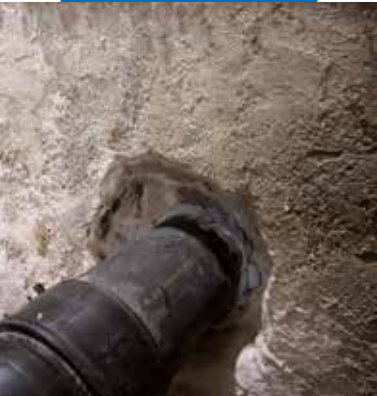
Mapeproof Swell appliqué