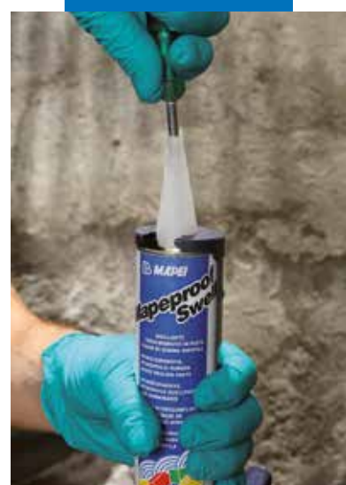
Percer la membrane de protection de la cartouche