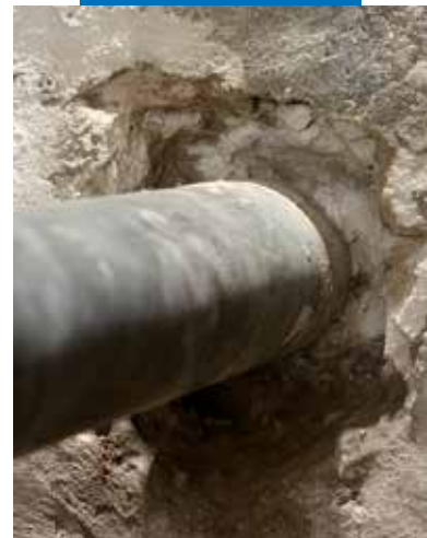
Démolir la structure autour du tube